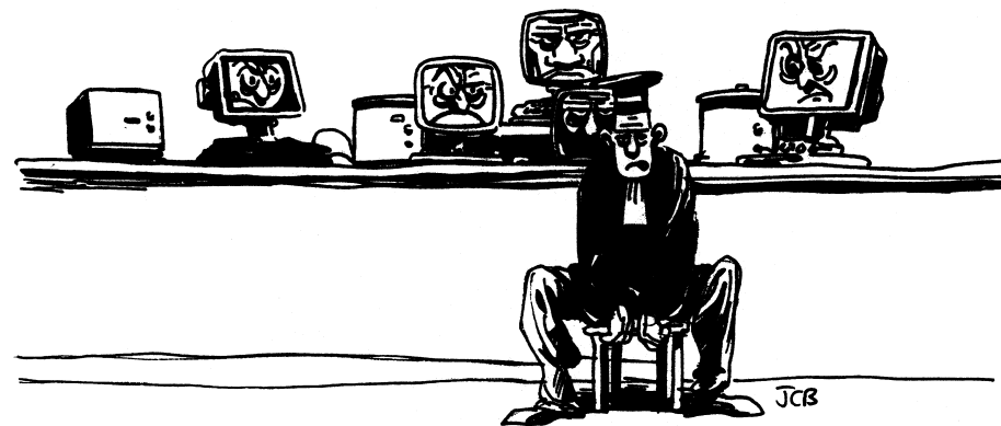
aus: Justice, Zeitschrift des französischen Syndicat de la magistrature, Juli 1998

Seit einiger Zeit werden die Bundesgesetzblätter im Oberlandesgericht Frank-