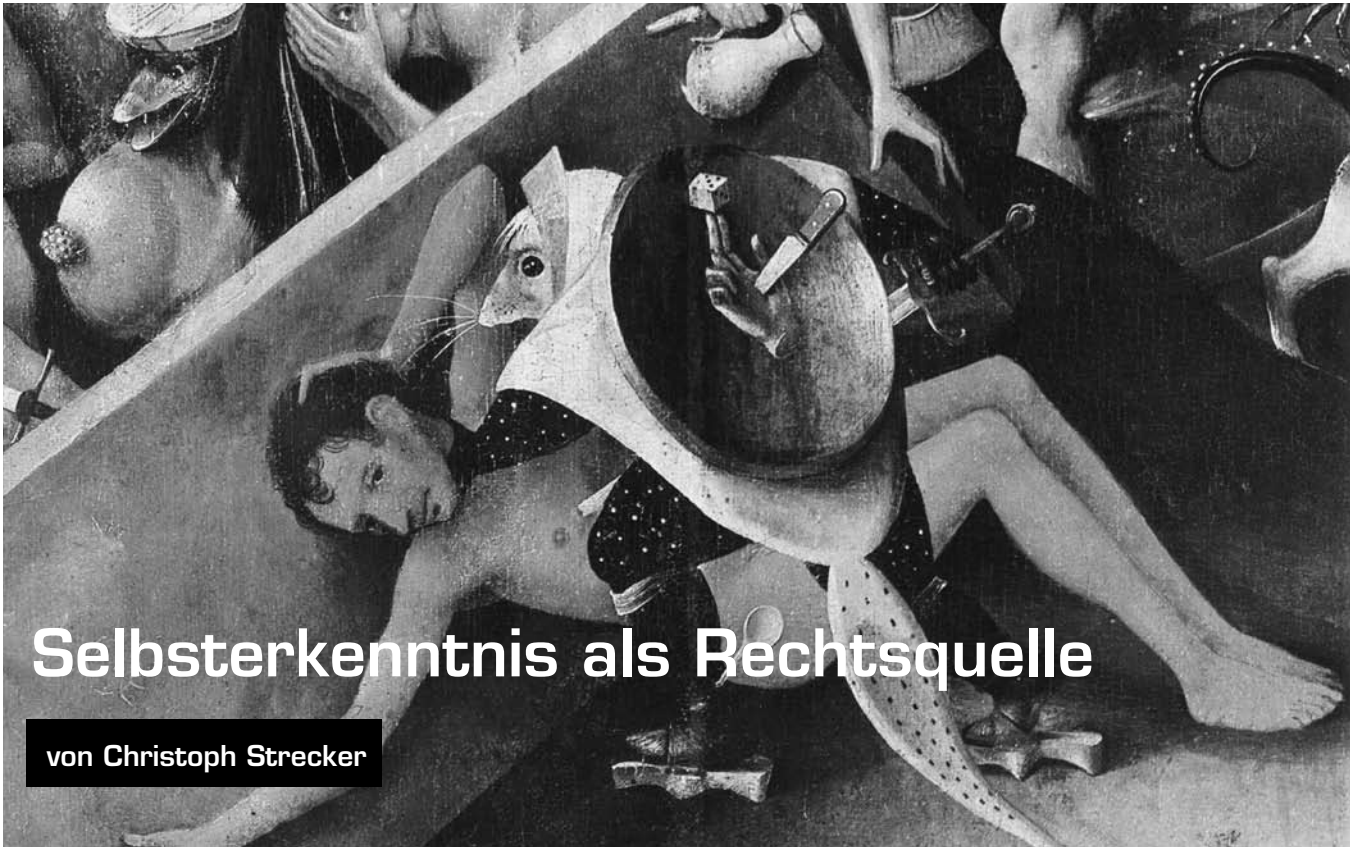
Bilder in diesem Artikel: Aus der Versuchung des Heiligen Antonius und aus dem Garten der Lüste von Hieronymus Bosch